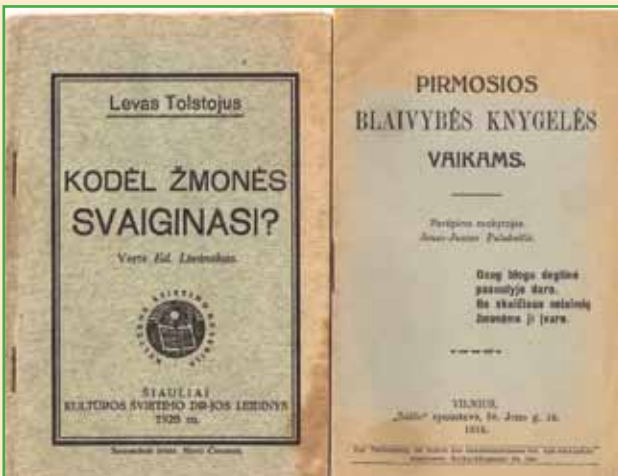
Tarpukario nepriklausomos Lietuvos literatūra blaivystės tematika