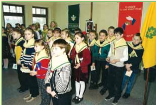
Plungės m. Vyskupo M. Valančiaus katalikiškosios pradinės mokyklos valančiukai