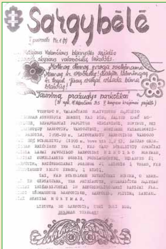
10 Kėdainių skyriaus valančiųjų laikraštis, 2000 m.